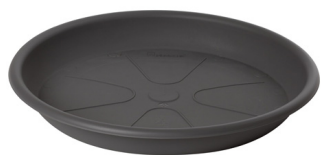
Sottovaso Omnia 22 Grigio Fumo

Caratteristiche tecniche: tutte le misure disponibili