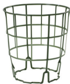
Gabbietta Per Gerani 13 Verde

Caratteristiche tecniche: tutte le misure disponibili