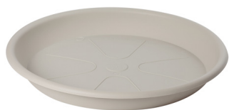
Sottovaso Omnia 34 Bianco Pietra

Caratteristiche tecniche: tutte le misure disponibili