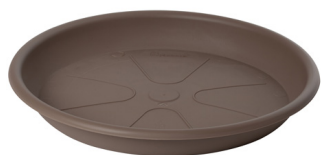
Sottovaso Omnia 45 Beige Scuro

Caratteristiche tecniche: tutte le misure disponibili