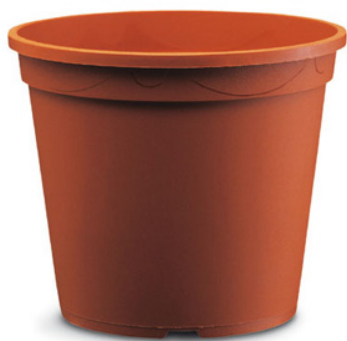
Vaso Normale Tondo Vaso Normale Tondo 18 Terracotta