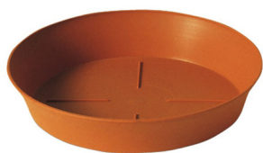
Sottovaso Export 20 Terracotta

Caratteristiche tecniche: tutte le misure disponibili