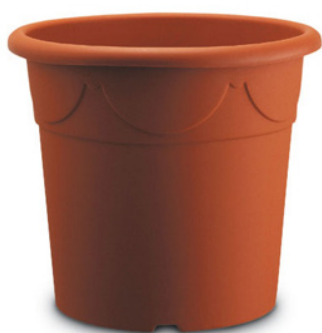
Vaso Pistoia Vaso Pistoia 18 Terracotta