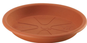
Sottovaso Omnia 26 Terracotta